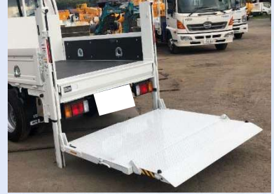
垂直ゲート部 寸法 [単位:mm]