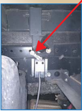
検出スイッチ取付例 (ストッパー付近に取付)