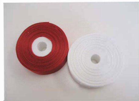
EC-024 紅白テープ 1セット