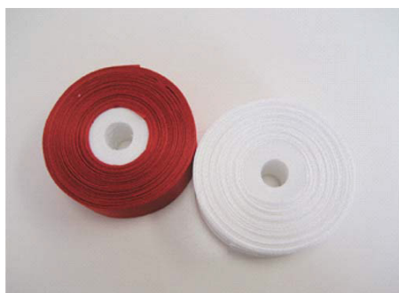
EC-024 紅白テープ 1セット