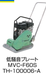
低騒音プレート MVC-F60S TH-100006-A