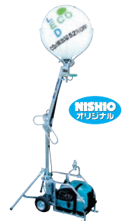
LEDミニムーンテラスター HR-100003-A