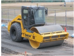
GPS・自動追尾転圧管理システム KT-010187-V