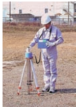
簡易支持力測定器 「キャスボル」 KK-980055-V