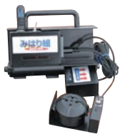
作業員装着警報感知システム「みはり組」 KT-090057-A