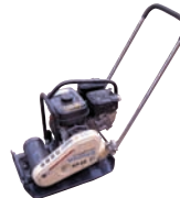
低騒音プレート KP-6S CB-100020-A