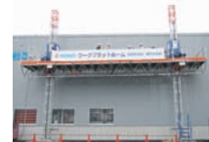
ワーク プラットフォーム KT-080002-A