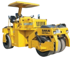
9t振動タイヤローラー GW750-2 KT-070017-A