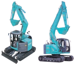
コベルコiNDR搭載 極低騒音バックホウ CG-100015-A