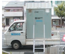
軽トラック積載型トイレユニット CB-100037-A