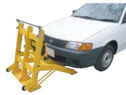
進入車両強制停止装置 「とまる君」 CB-080028-A