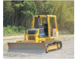
3次元マシンコントロールシステム 3D-MC KT-990421-V