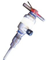
コンクリートブレーカー消音器 「CBRマフラー」 CG-080023-A