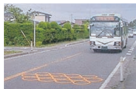
簡易式体感マット「ピタリング」 TH-040016-V