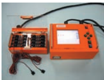
コンクリートの 充填検知システム 「ジューテンダー」 KT-090011-A