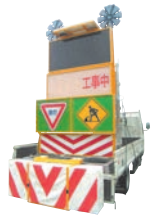
大型ソーラー規制看板 HR-090017-A