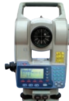
ひび割れ計測システム 「KUMONOS」 KK-080019-V