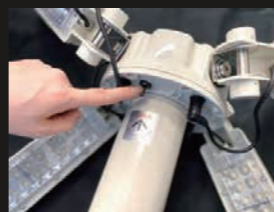
3段階照度切り替え