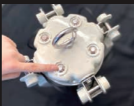
点灯アーム選択可能