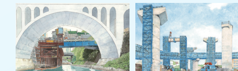
モリナガ・ヨウの土木展

※聖橋/御茶ノ水駅改良工事(土木学会誌2021年5月号表紙)=左 ※横浜環状南線・横浜湘南道路 栄IC-JCT工事(土木学会誌2021年1月号表紙)=右