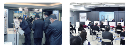
建設技術展2021 関東の様子