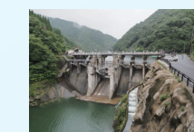
第13回土木写真部写真展 NO DOBOKU, NO LIFE. 土木技術者による土木構造物だけの写真展