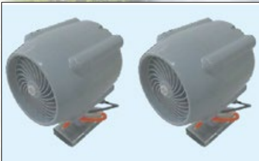
ノズル付き電動ファン 2個