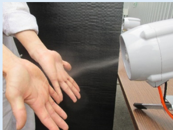
水を消毒液に変えることで 手指の除菌に！