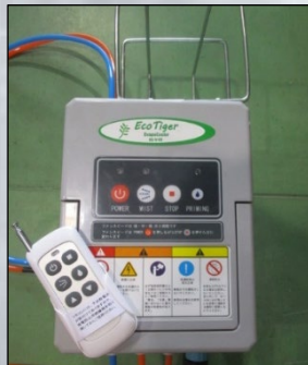
ミスト発生ユニット