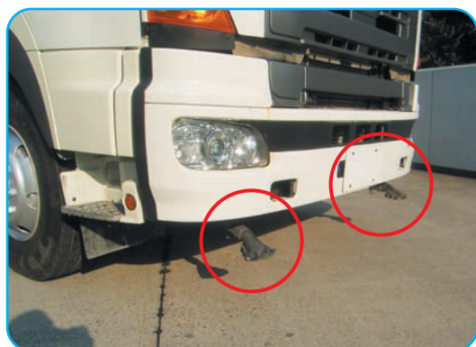
バリアブルノズル(左右上下可変可能)