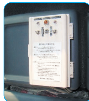
前後散水開閉操作盤 (運転席内)