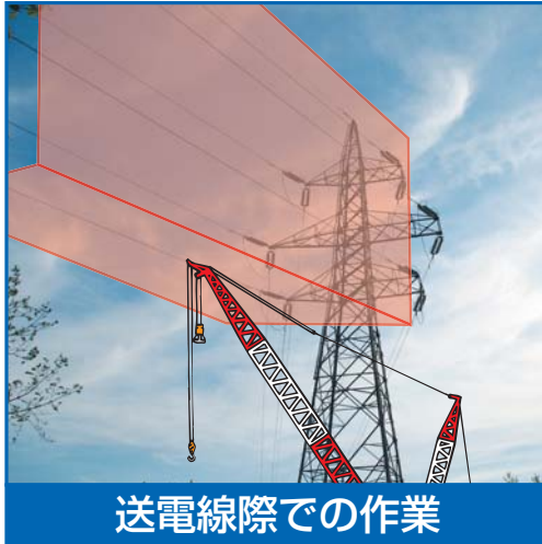
送電線際での作業