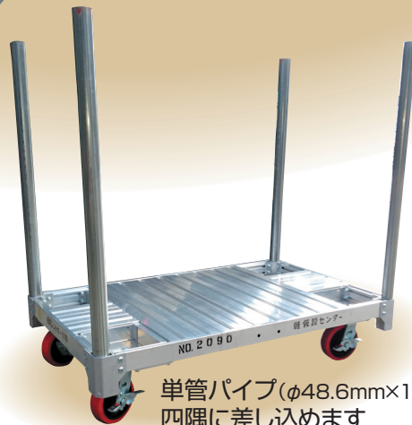
単管パイプ(φ48.6mm×1m)を 四隅に差し込めます