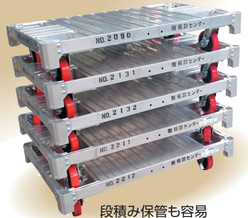
段積み保管も容易