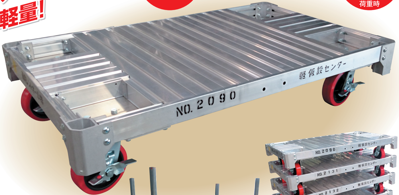
単管パイプ差し込み口