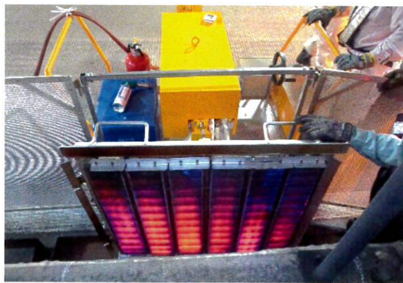
② 2～3分間タイルの表面を熱します。