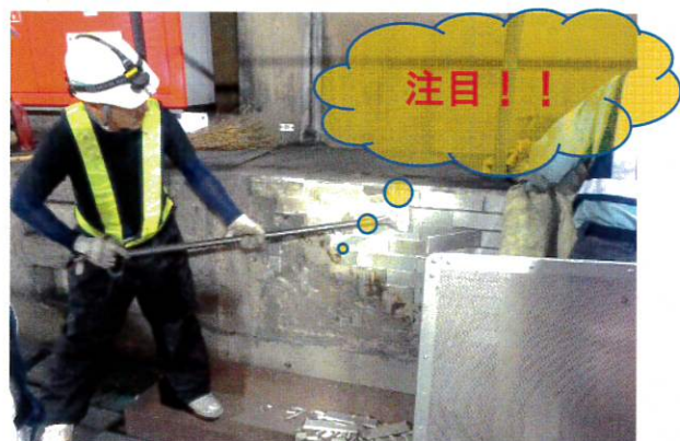
③ケレン棒（ヘラ）をタイルの背面に差込むとタイルが パラパラ っと剥がれ落ちます。