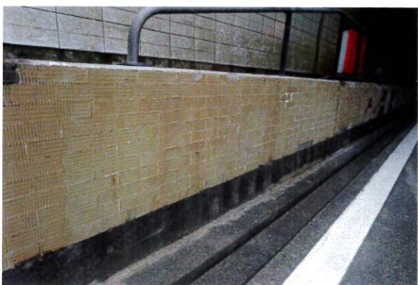
④後は落ちたタイルを拾い集めて撤去完了 注) タイルを剥がした後は、コンクリート面に樹脂が残ります。