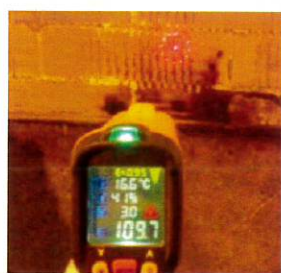
コンクリート受熱温度

※タイル直下のコンクリート表面温度は100℃程度です。 (強度等コンクリートの性状に影響を及ぼしません)