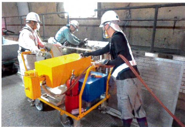
① 遠赤外線ヒーターをセット