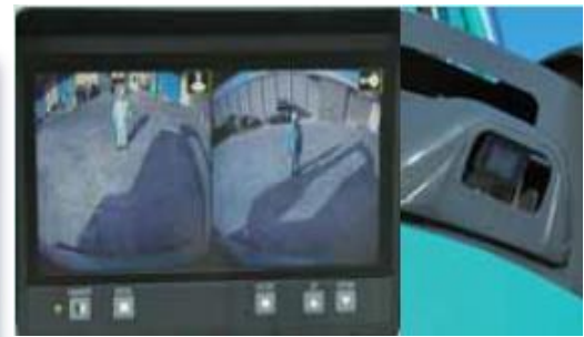
右カメラ 後方カメラと同時に表示