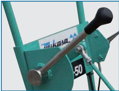
ワイヤーブレード 調節レバー